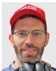
קסם לי מנכ"ל החינוך צרכנים למען צרכנים