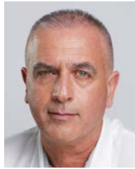
שחר תורג'מן נשיא איגוד לשכות המסחר